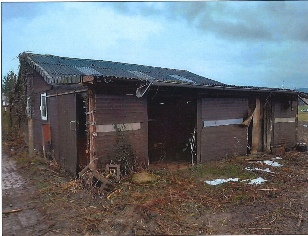
Foto 3: Ehemaliger Pferdestall / 14.01.2026