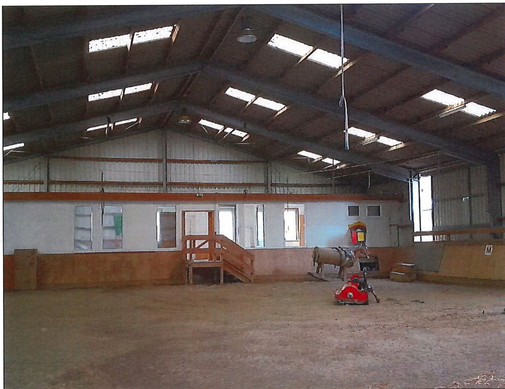
Foto 2: Reithalle von innen / 14.01.2026