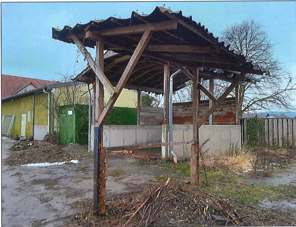
Foto 5: Gebäuderudiment von der vormaligen Pferdehaltung, dahinter die ebenfalls zum Abriss vorgesehene Lagerhalle (vgl. Foto 1, rechte Seite) / 14.01.2026