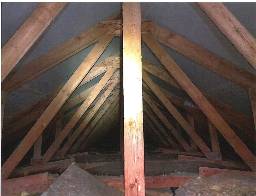
Foto 8: Dachgeschoss desselben Geb udes wie Fotos 6 und 7 mit Unterspannbahnen / 11.02.2026