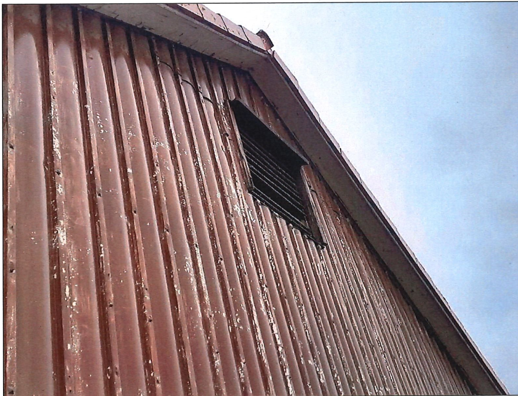
Foto 6: Westlichstes Funktionsgebäude mit potenzieller Einschluþmöglichkeit in das Dachgeschoss / 14.01.2026