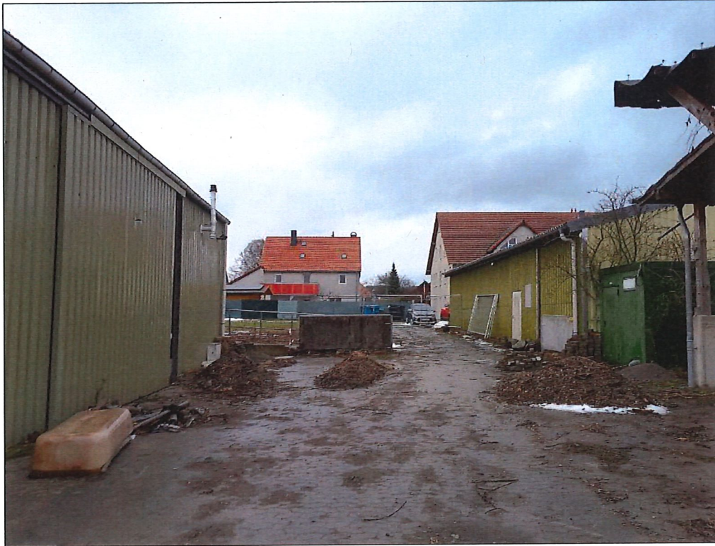
Foto 1: Zum Abriss vorgesehene Reithalle (links) und Lagerhalle (rechts) / 14.01.2026