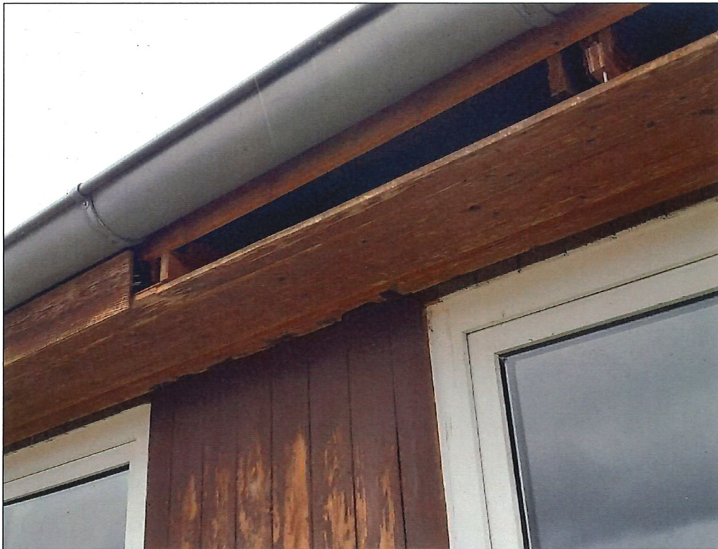
Foto 7: Seitliche Einschlu fm glichkeit in das Dachgeschoss desselben Geb udes wie Foto 6 / 14.01.2026